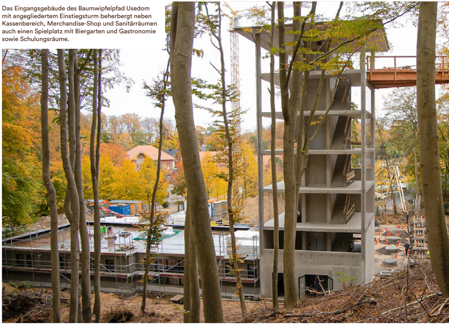
Das Eingangsgebäude des Baumwipfelpfad Usedom mit angegliedertem Einstiegsturm beherbergt neben Kassenbereich, Merchandise-Shop und Sanitärräumen auch einen Spielplatz mit Biergarten und Gastronomie sowie Schulungsräume.