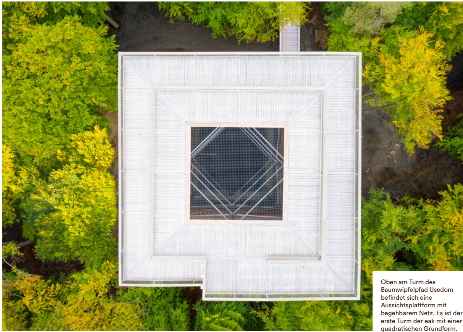
Oben am Turm des Baumwipfelpfad Usedom befindet sich eine Aussichtsplattform mit begehbarem Netz. Es ist der erste Turm der eak mit einer quadratischen Grundform.