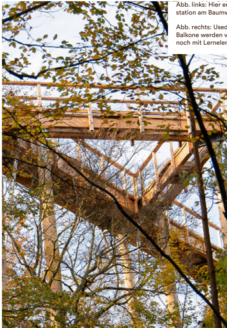
Abb. rechts: Usedom's Didaktik-Balkone werden vor der Eröffnung noch mit Lernelementen bestückt.