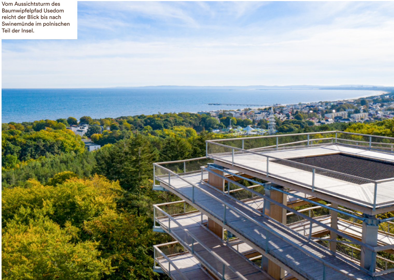
Vom Aussichtsturm des Baumwipfelpfad Usedom reicht der Blick bis nach Swinemünde im polnischen Teil der Insel.