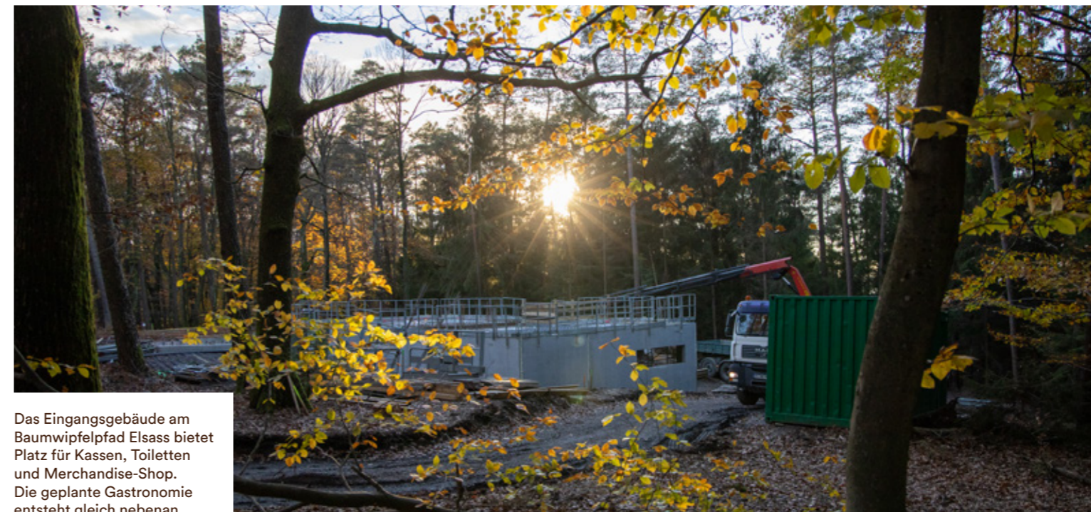
Das Eingangsgebäude am Baumwipfeldpfad Elsass bietet Platz für Kassen, Toiletten und Merchandise-Shop. Die geplante Gastronomie entsteht gleich nebenan.