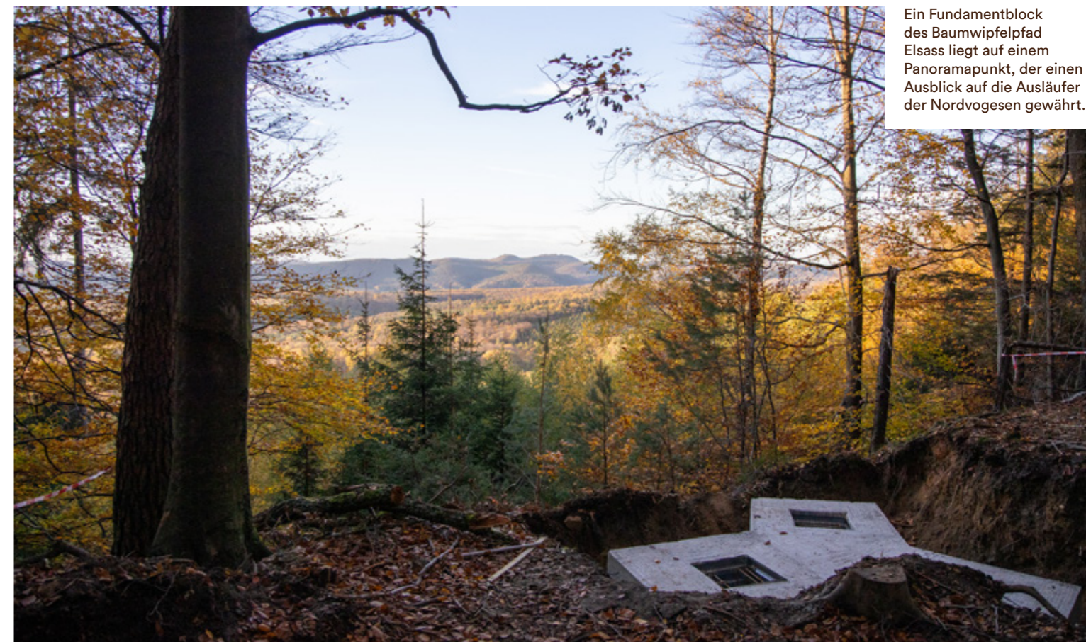
Ein Fundamentblock des Baumwipfeldpfad Elsass liegt auf einem Panoramapunkt, der einen Ausblick auf die Ausläufer der Nordvogesen gewährt.