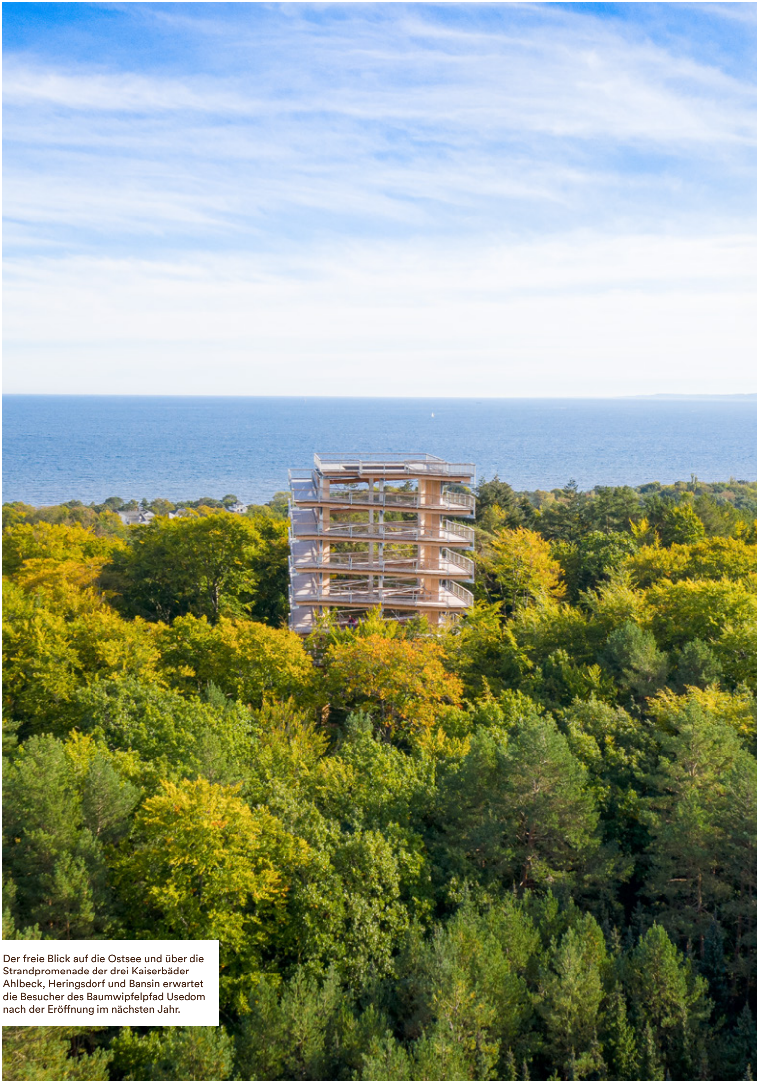
Der freie Blick auf die Ostsee und über die Strandpromenade der drei Kaiserbäder Ahlbeck, Heringsdorf und Bansin erwartet die Besucher des Baumwipfelpfad Usedom nach der Eröffnung im nächsten Jahr.