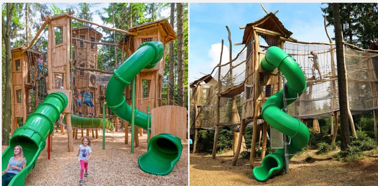
ABBILDUNG 2: ABENTEUERSPIELPLÄTZE DER ERLEBNIS AKADEMIE: SCHWARZWALD (LS) UND LIPNO (RS)